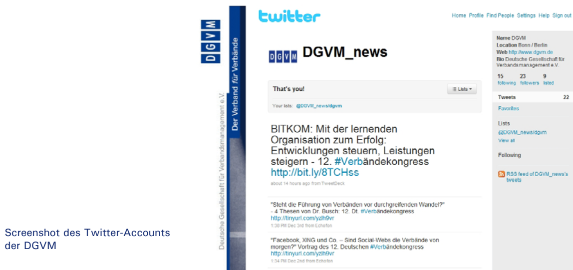
Screenshot des Twitter-Accounts der DGVM

Wie auch in den Vorjahren ist die DGVM von zahlreichen Medien wieder um Informationen und Stellungnahmen zu aktuellen Fragen der Verbände gebeten worden.